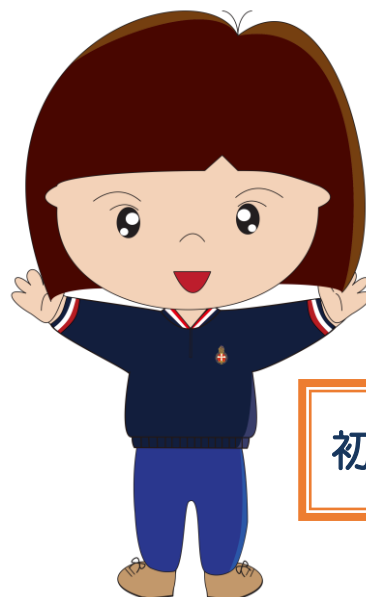
初、中、高 及 深資組